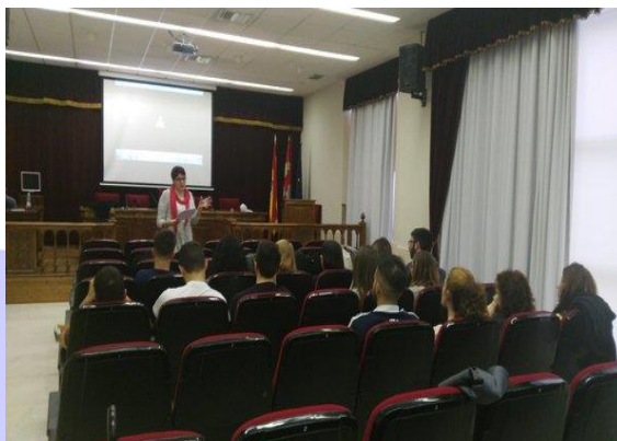
Ilustración 2. Clase temática.

Durante el mes de febrero, un total de 17 alumnos de cuarto curso del Grado en Criminología de la Universidad de Salamanca comenzaron sus prácticas con el equipo de la UACC. El periodo de prácticas se desarrolló en torno a tres grupos de actividades: clases formativas, talleres e integración en los grupos de investigación.