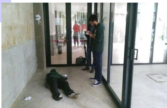
Ilustración 3. Alumnos participan en el taller de análisis de escenas

De forma paralela al desarrollo de estas actividades, los alumnos se integraron en los diferentes grupos de investigación.